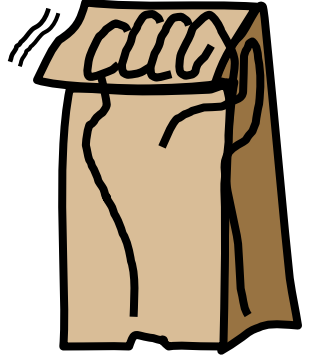
تھیلی کو ہاتھ پر رکھ کر، پتی کے منہ کو بلائیے۔