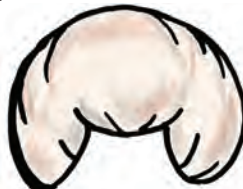
TURBANTE = tostado claro