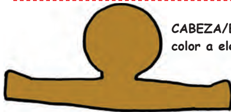
CABEZA/BRAZOS = color a elegir