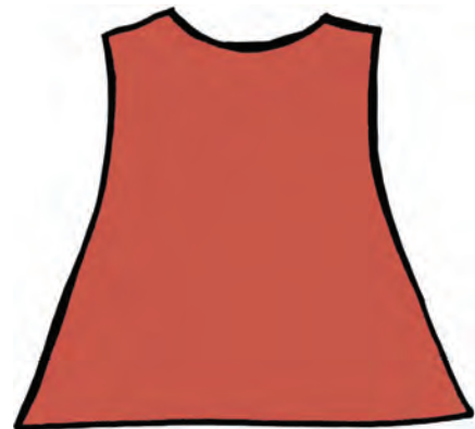
ESPALDA DE LA TÚNICA = morado o rojo oscuro

Decoración opcional para la túnica: (ver sugerencias en Materiales arriba)