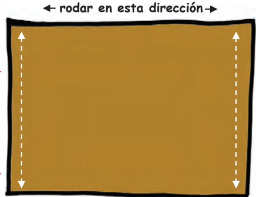
SOPORTE PARA EL DEDO = color a elegir

Cosa o pegue los bordes derecho e izquierdo juntos para hacer un "tubo" para el dedo.