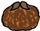
BARBA = marrón