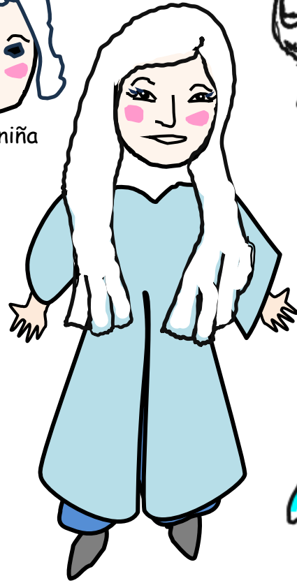
La princesa joven