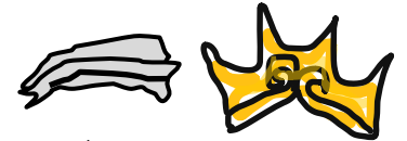
Un gorro de pastor y una corona

Sugerencia: Para el rey, dibuje y recorte una corona y un gorro de pastor para intercambiarlos mientras se lee el cuento. Estas piezas se pueden sujetar en su lugar con clips. O: dibuje y coloree las partes de la cabeza (rostros, barbas, gorros, cabello, etc.) en papel artístico del tamaño de la solapa y péguelo todo en su lugar. Opcional: como adornos, pegue ojos de plástico, botones, tela para pañuelos de cabeza y cuello, o hilo para el cabello.