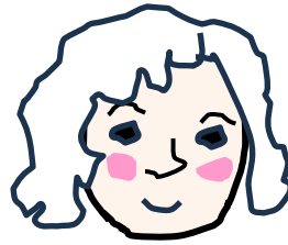
La princesa niña